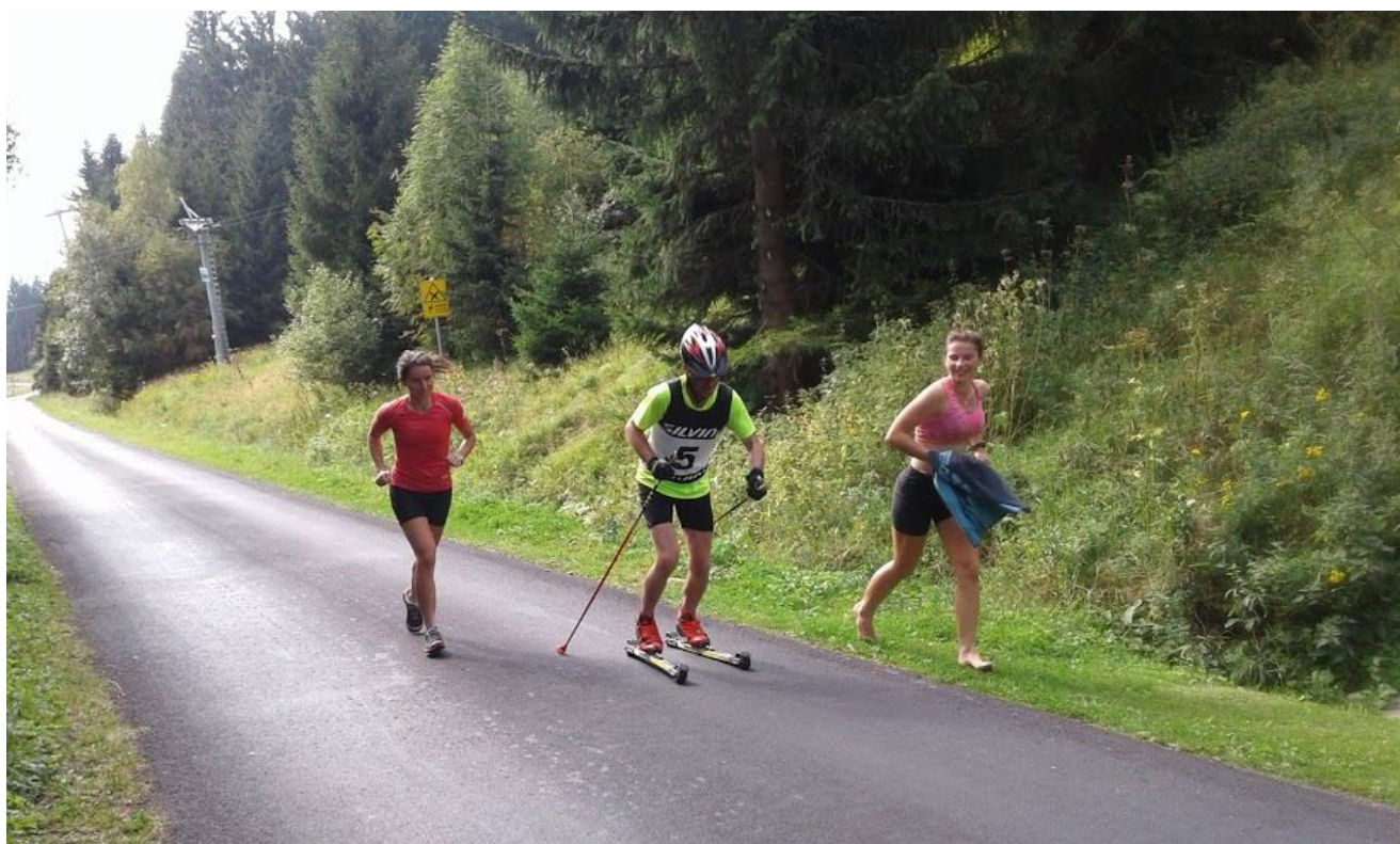
Někteří se měli , páč ,měli podporu od doběhnuvších děvčat :) před cílem