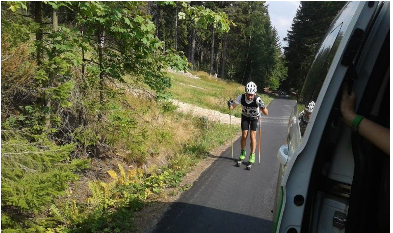
A už je tu závěrečné 5km stoupání od sjezdíku z Hoffmannek, Jedla opět v akci :)