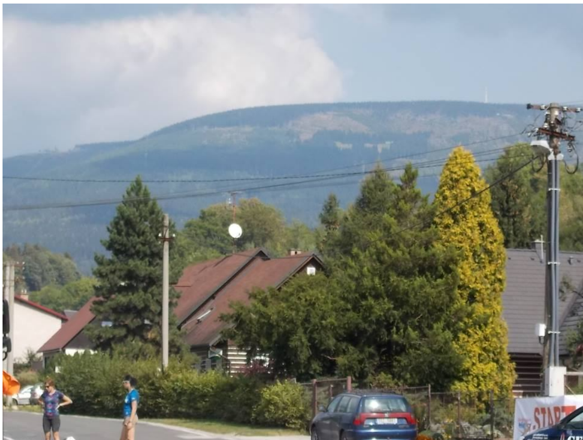
Černá hora(1299mnm a kousek pod ní je vidět Zinneckerova bouda(1100mnm), pohled od startu