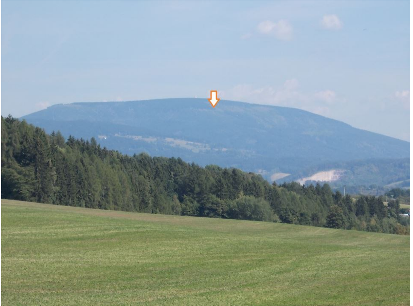
Černá hora 1299mnm, šipka označuje Zinneckerova boudu 1100mnm, foceno nad Vrchlabím

Černá hora (německy Schwarzenberg či též Spiegelkoppe) je hora ve východních Krkonoších, nacházející se 3,5 km severozápadně nad lázeňským městečkem Janské Lázně a 5 km jižně od Pece pod Sněžkou. S výškou 1299 m nepatří mezi nejvyšší krkonošské vrcholy, ale s prominencí 215 metrů (převýšení od sedla s Liščí horou nad Hrnčířskými Boudami) jde o třetí nejprominentnější horu Krkonoš a dominantu rozlehlé Černohorské rozsochy.