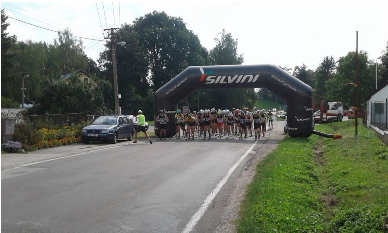
Start v žlutém leader soutěže Standa Řezáč